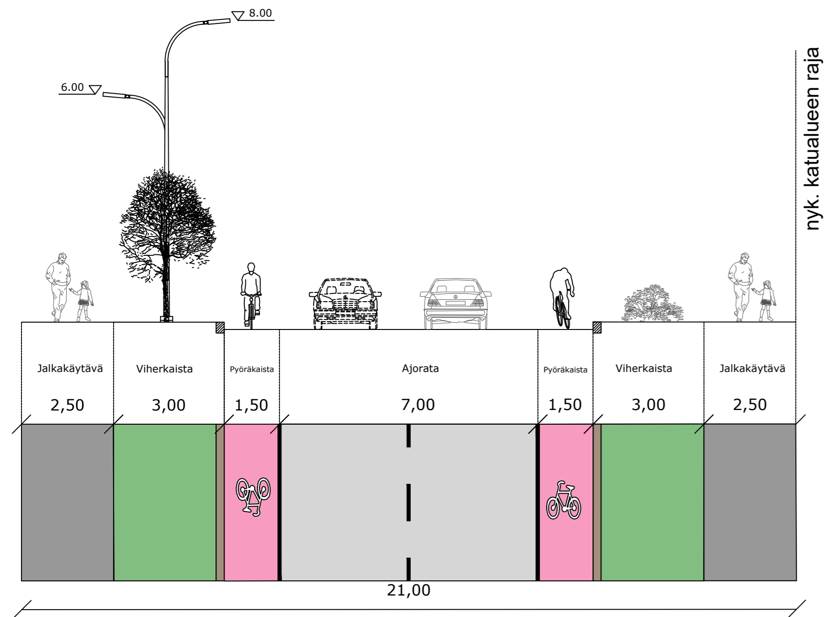
TYYPPIPOIKKILEIKKAUS 1:100 A-A